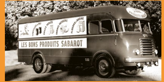
Camion publicitaire Sabarot

par le bout du nez en découvrant les œuvres du musée sous un nouveau jour grâce à un orgue à parfums.