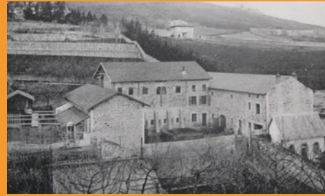
Hall ancien du musée