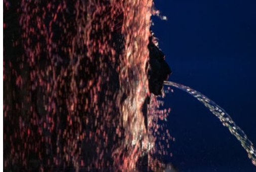
Fontaine Crozatier, Le Puy